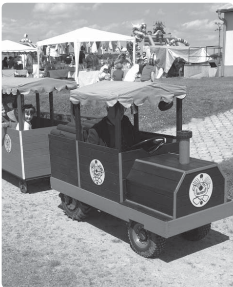
Oslava dětského dne na fotbalovém hřišti. Další fotografie z akcí k DD v příštím zpravodaji.